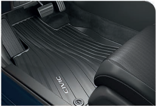
Tapetes toda temporada