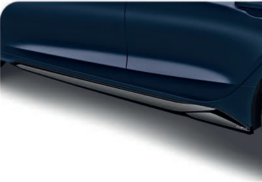
Spoiler lateral color negro