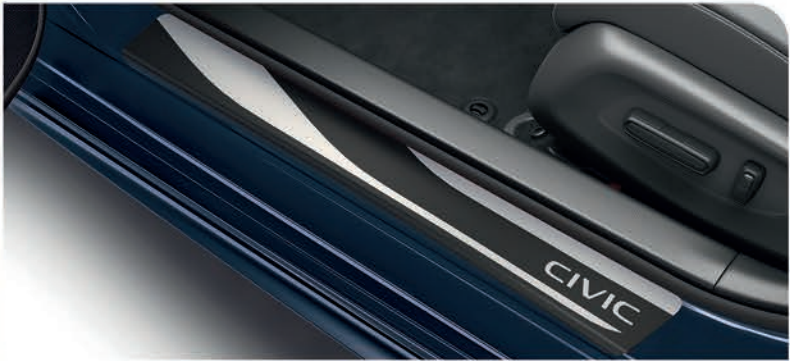
Película protectora del piso de puerta