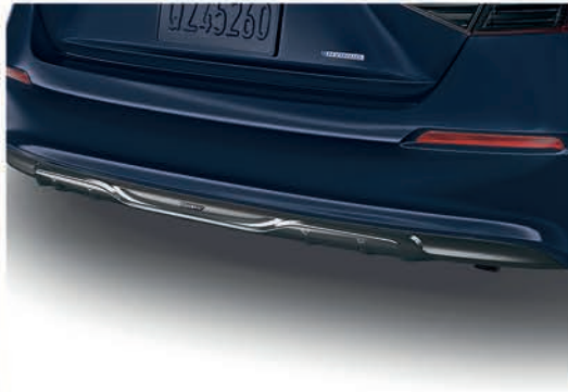
Spoiler trasero color negro