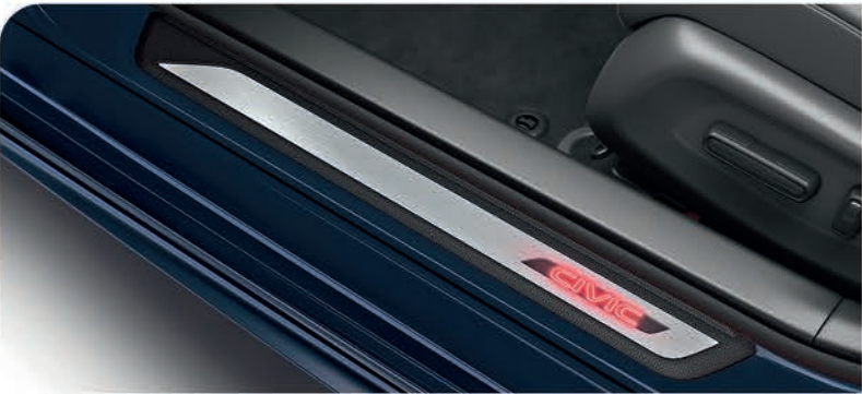
Adorno de piso de puertas iluminado