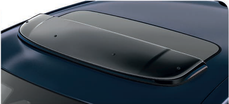
Deflector de aire para quemacocos