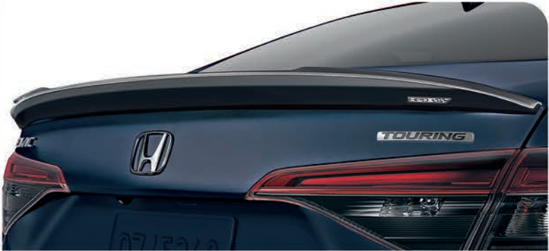
Alerón trasero color negro