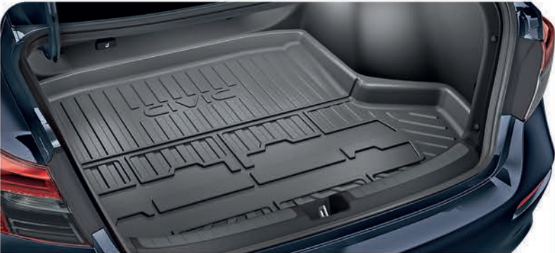
Bandeja de carga